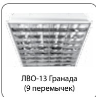
ЛВО-13 Гранада (9 перемишек)