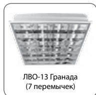
ЛВО-13 Гранада (7 перемишек)